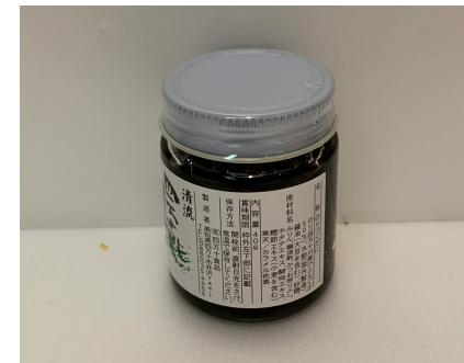
のりつくだに (青しその実入り)