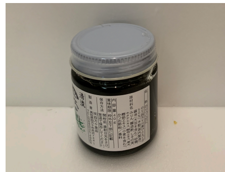
のりつくだに (鰹味)