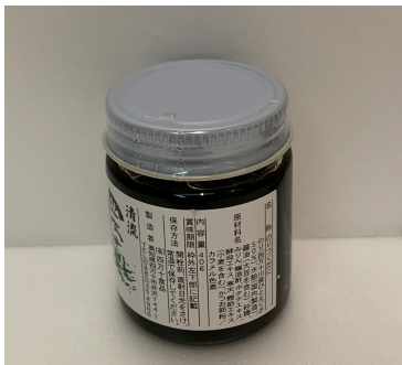
のりつくだに (醤油)